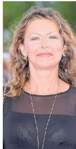
Da sinistra: Michela Murgia, Alessio Boni, Amanda Sandrelli

& Games per il progetto Graphic novel theatre e vedrà in scena, oltre ad Amanda Sandrelli, "attori" animati nati grazie alle scene digitali realizzate da Imaginarium Creative Studio.